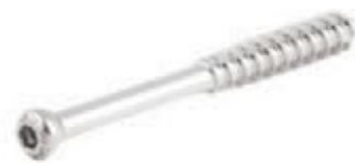
Tornillo Esponjoso Canulado 7mm Rosca 32