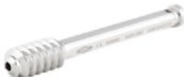
Tornillo Deslizante DHS Tipo AO