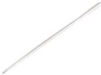
Clavo Femoral Canulado ILF 9/10/11/12 - 300 A 440 mm