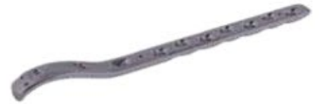
Placa Fémur Proximal Bloq. 856T 5/7/9/11/13/15 Orificios - IZQ/DER