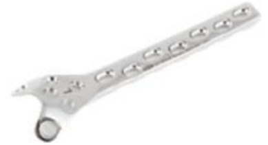
Placa de Condilar Sustentación 815 7 y 9 Orificios - IZQ/DER