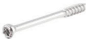
Tornillo Esponjoso Canulado 4.5mm Rosca Parcial