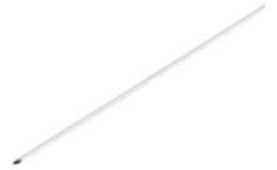
Alambre Roscado Parcial-Total Kirschner PS913