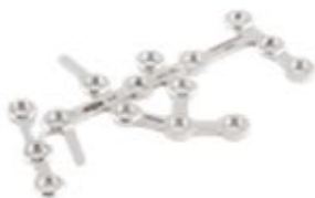
Placa Calcaneo Bloqueada