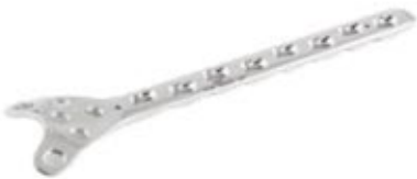
Placa Condilar Sustentación Bloqueada