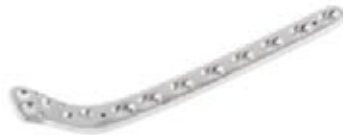
Placa Tibial Proximal Bloqueada (Hockey)

928 4/6/8/10/12/14/16 Orificios - IZQ/DER