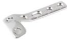
Placa en "L"

652 5 Orificios IZQ - 5 a 12 Orificios DER