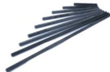
Barra Fibra de Carbono 11 mm