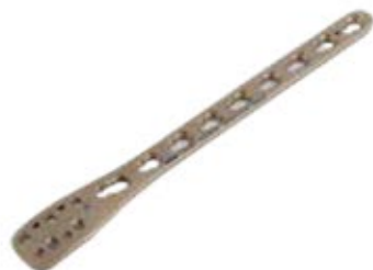
Placa Peroné Distal 942T 3/5/7/9/11 Orificios - IZQ/DER