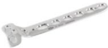
Placa "T" c/Soporte Bloqueada - 2