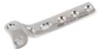
Placa "T" de Sustentación - 2