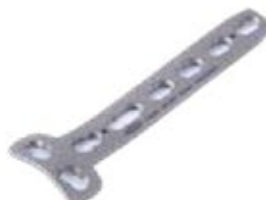
Placa "T" Bloq. 850T 4 a 8 Orificios