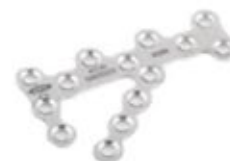
Placa de Calcaneo 812 60 y 70 mm