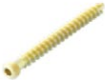
Tornillo Esponjoso 6.5mm Cab./Ros.