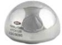
Prótesis Cadera Bipolar HTC 39 a 55 mm (impares) -3 -0 +3