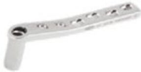
Placa Tubo 95° DCS (A0)