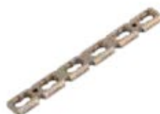
Placa Reconstrucción 920T 4 a 10/12/14 Orificios