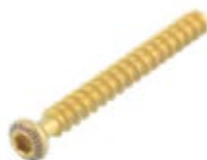
Tornillo Esponjoso 4mm (Rosca Total)