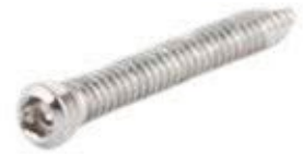
Tornillo Fijación 2.7mm Cabeza Roscada