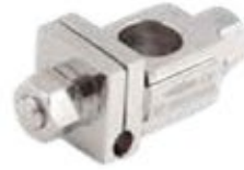
Abrazadera Ajustable Simple Fijador Externo