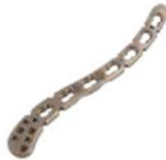
Placa Clavícula Ant. Lat. 921T 6 a 8 Orificios - IZQ/DER