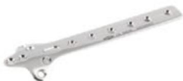
Placa Trebolar 608 3 a 6/8/10/12 Orificios