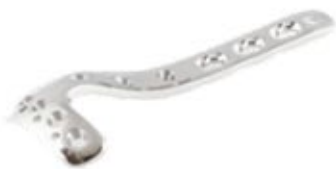
Placa Tibia Proximal 906 4/6/8/10/12/14 Orificios - IZQ/DER