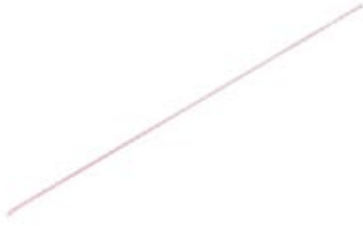
Haste Fin (Flexible Nail)