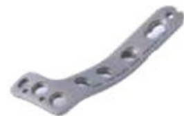
Placa Tibial Proximal 928T 4/6/8/10/12/14/16 Orificios - IZQ/DER