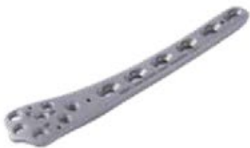
Placa Distal Femoral 851T 5 a 13 Orificios - IZQ/DER