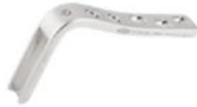
Placa Angulada 95°

604 5/7/9/12 Orificios - Hoja 50/60/70/80