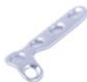
Placa en "L" Oblicua Ø 2.7mm 672 2 X 3 Orificios - IZQ/DER