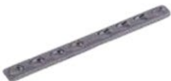
Placa Estrecha DCP 618T 6 a 10/12 Orificios