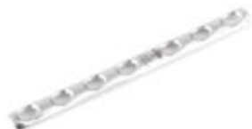
Placa Tubular 1/3 639 2 a 12 Orificios