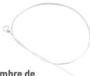
Alambre de Cerclaje Loop PS924