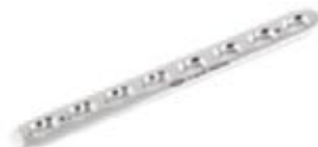
Placa Estrecha Bloqueada 845 5 a 14 Orificios