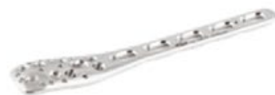
Placa Philos Bloqueada