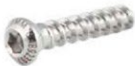
Tornillo Esponjoso 3.5mm Rosca Total