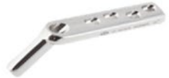
Placa Tubo 135° DHS (A0)

605 5/7/9/12 Orificios - Hoja 50/60/70/80