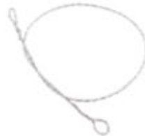
Alambre GIGLI Ordinario IKS1081 30/50cm