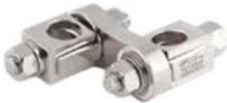
Junta Universal (Recto - Curvo)