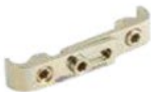
Cross Link Montado