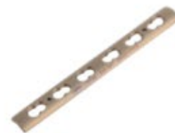
Placa Tubular 939T 4 a 12 Orificios