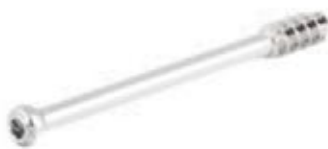
Tornillo Esponjoso Canulado 7mm Rosca 16