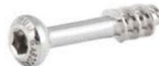
Tornillo Esponjoso 4mm Rosca Parcial