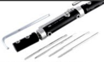
Fijador Externo Dinámico (Húmero - Tibia - Fémur)