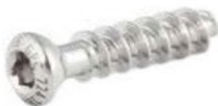
Tornillo Esponjoso 4mm Rosca Total