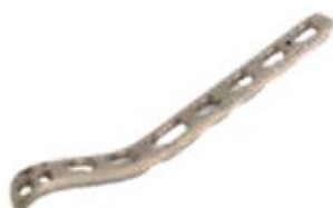
Placa Medial Humeral 927T 3/5/7/9/11/14 Orificios - IZQ/DER