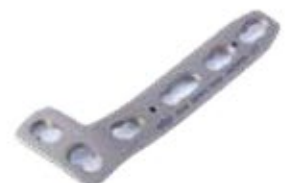
Placa "L" c/Soport Bloq. 858T 3 a 11 Orificios - IZQ/DER