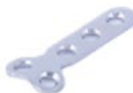
Placa en "T" Ø 2.7mm 672 2 X 3 Orificios