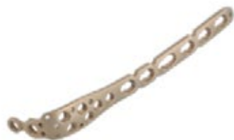
Placa Olecranon Bloq. 903T 3 a 10/12 Orificios - IZQ/DER