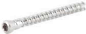
Tornillo Fijación Esponjoso 5mm Cabeza Roscada