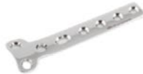
Placa "T" - 2