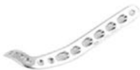
Placa Tibia Distal Antero Lateral 936 6/8/10/12 Orificios - IZQ/DER