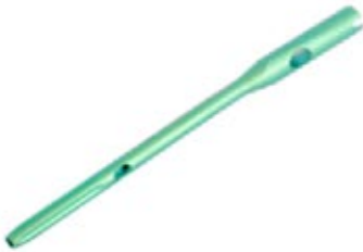
Clavo Femoral Proximal IntraHEAL ADV