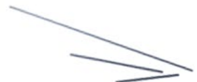
Barra Fibra de Carbono 4.0 mm