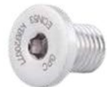
Tapón Clavo Supra Condylar ECIN