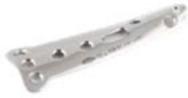
Placa Cuchara 638 5 y 6 Orificios