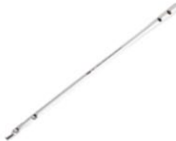
Clavo Supra Condylar IMN 8/10/11/12 - 150 a 400 mm