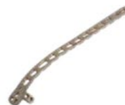
Placa Dorsolateral c/sop 915T 3/5/7/9/11/13 Orificios - IZQ/DER