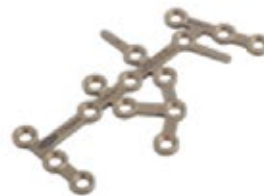
Placa Calcaneo 902T 69 y 76 mm Orificios - IZQ/DER