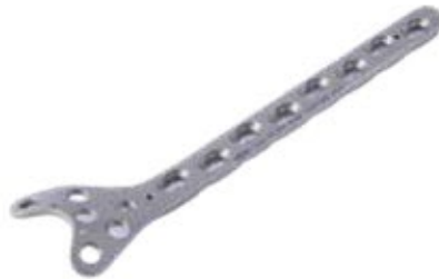
Placa Condilar Susten. 841T 6/8/10/12 Orificios - IZQ/DER