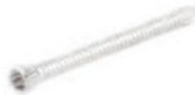
Tornillo Fijación 5mm Cabeza Roscada