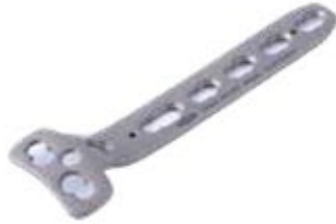
Placa "T" c/Soporte Bloq. 855T 3 a 11 Orificios