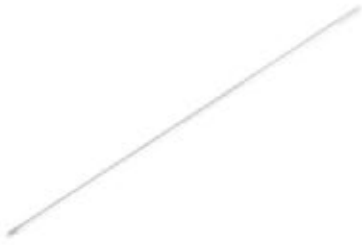
Alambre Steinmann PS901