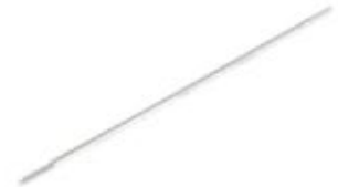
Clavo de Schanz