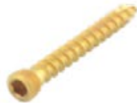
Tornillo Esponjoso 3.5mm Cab./Ros.