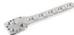
Placa Humeral Proximal Bloqueada