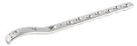
Placa Fémur Proximal Bloqueada