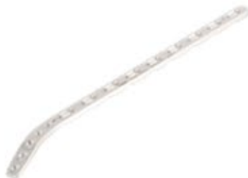
Placa Húmero Distal Lat - DER 929 5/7/9/ 11/13/15 Orificios - DER