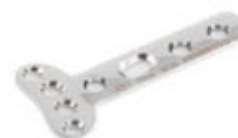
Placa "T" - 4 642 4 x 3 a 6 Orificios