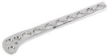
Placa Sustentación (Hockey) LC-DCP Tibial 819 5/7/9/11/13 Orificios IZQ - 5 y 7 Orificios DER