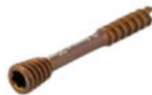
Tornillo Canulado Herbert 2.4mm Titanium