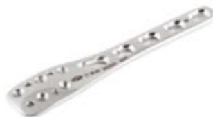
Placa Peroné Lateral 942 3/5/7/9/11 Orificios - IZQ/DER