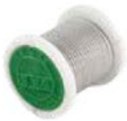
Alambre Satura PS912 Cal. 16/18/20/22/24/28/32/34