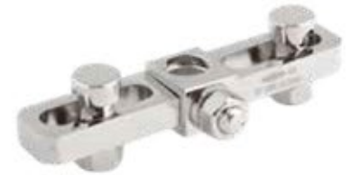
Abrazadera Transversal Fijador Externo