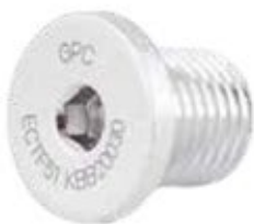
Tapón Tibial-Femural ECTF