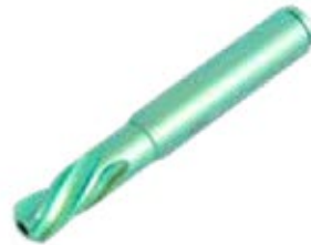
Tornillo Deslizante ADV Canulado