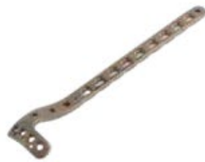
Placa Tibia Proximal 906T 4/6/8/10/12/14 Orificios - IZQ/DER