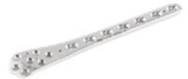
Placa Fémur Distal Bloqueada

840 4/6/8/10/12/14/16 Orificios - IZQ/DER