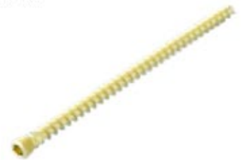
Tornillo Esponjoso 5.0mm Cab./Ros.