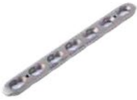
Placa Estrecha Bloq. 848T 4 a 12/14 y 16 Orificios