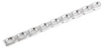
Placa de Reconstrucción 634 6 a 10/12 Orificios