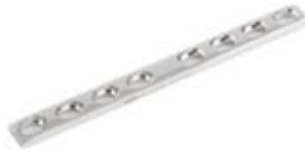
Placa Estrecha (DCP) 618 6 a 10/12 Orificios