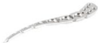
Placa Clavicula Superior Ant. Lateral Externo