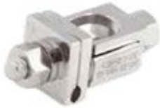
Abrazadera Abierta Fijador Externo