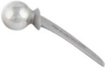
Prótesis Cadera Thompson THP 37 a 54 mm