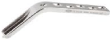
Placa Angulada 130°

604 5/7/9/12 Orificios - Hoja 50/60/70/80