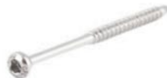
Tornillo Maleolar 4.5mm Rosca Parcial