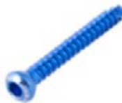
Tornillo Cortical 4.5mm Autorroscable

736T 14 a 60 [pares] /65/70/75/80/85/90 RT