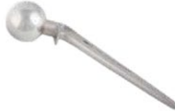
Prótesis Cadera Lazcano TLP 38 a 54 mm