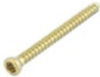
Tornillo Cortical 2.4mm (Estrella)