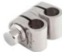
Junta Universal (Tubo - Tubo)