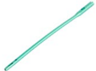
Clavo Femoral Proximal Largo IntraHEAL ADV