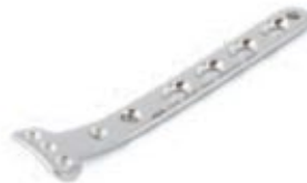
Placa Tibial Proximal Medial