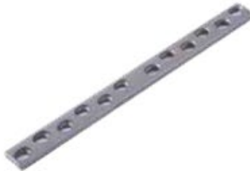
Placa Ancha DCP 619T 7/8/9/10/12 Orificios