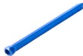
Tornillo Fijación 5mm

765T 10 a 60 (pares) /65/07/75/80 mm - RT