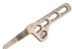
Placa Clavícula Gancho 902T 4 y 5 Orificios - Gancho 12/15/18 mm