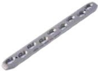
Placa Ancha Bloq. 849T 6 a 12/14 y 16 Orificios