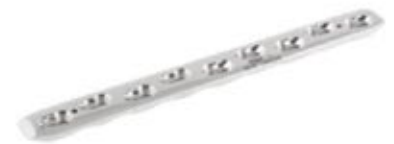
Placa Ancha Bloqueada