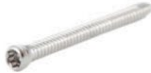
Tornillo Fijación 2.4mm Cabeza Estrella