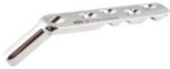
Placa DHS 135° Bloqueada