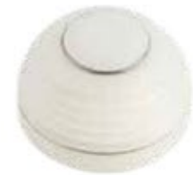
Prótesis Acetabular THR38 28 x 42 a 58 mm (pares)