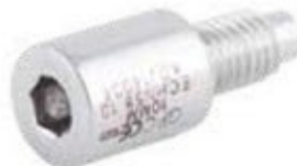
Tapón Clavo Humeral ECHN 0/5/10/15 mm