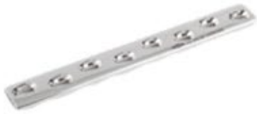
Placa Ancha LC-DCP 630 6 a 11 Orificios