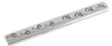
Placa Ancha (DCP)