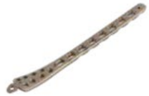
Placa Distal Tibial Bloq. 867T 4/6/8/10/12/14 Orificios - IZQ/DER