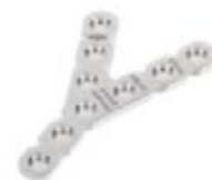
Placa de Reconstrucción "Y" 636 6/9/12 Orificios