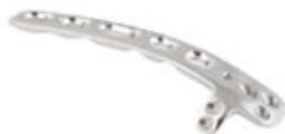
Placa Humero Distal Dorsolateral c/Soporte