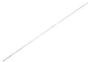
Alambre Kirschner PS911