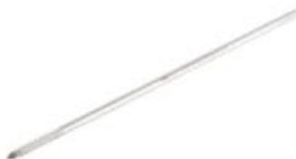
Barra Pequeña de Conexión