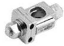
Abrazadera Ajustable Doble Fijador Externo