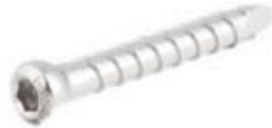
Perno de Bloqueo 3.9mm ILB39 24 a 50 mm (pares)