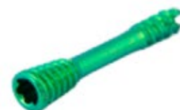
Tornillo Canulado Herbert 3.0mm Titanium