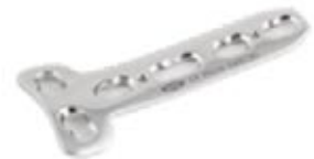
Placa "T" Bloqueada - 2