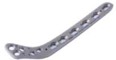
Placa Tibial Proximal Bloq. 840T 4/6/8/10/12/14/16 Orificios - IZQ/DER