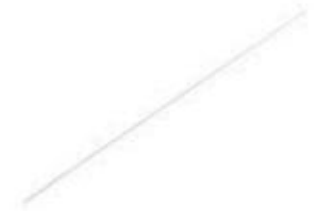
Alambre Guía Roscado Central Steinmann PS918 2 x 230mm