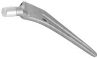
Prótesis Cadera Muller THR36 7.5/10/12 mm