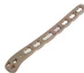
Placa Dorsolateral 905T 3/5/7/9/14 Orificios - IZQ/DER