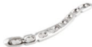
Placa Clavicula "S" Bloqueada