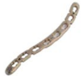
Placa Clavícula "S" 933T 3 a 12 Orificios