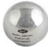
Prótesis Cabeza Intercambiable THR37 28 mm - Corta -3 - Mediana -0 - Larga +3