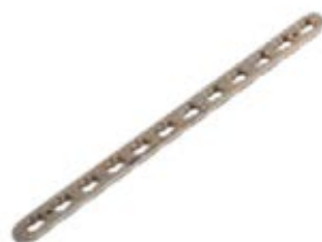
Placa Estrecha Bloqueada 845T 5 a 14 Orificios