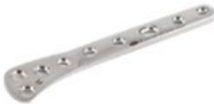
Placa Tibial Distal

652 5 Orificios IZQ - 5 a 12 Orificios DER