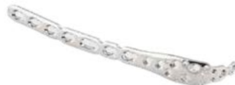
Placa Olecranon Bloqueada