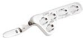
Placa Clavicula c/Gancho Bloqueada