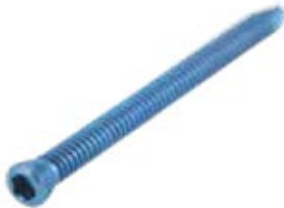
Tornillo Fijación 3.5mm Cab./Ros.

765T 10 a 60 (pares) /65/07/75/80 mm - RT