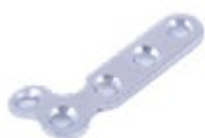
Placa en "L" Ø 2.7mm 672 2 X 3 Orificios - IZQ/DER