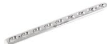
Placa Estrecha Bloqueada