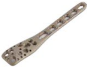
Placa Philos Bloqueada 938T 3 a 12 Orificios