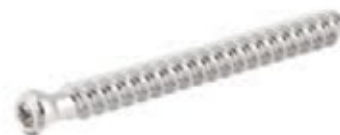
Tornillo Esponjoso 6.5mm Rosca Total