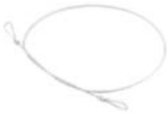
Alambre GIGLI Fino IKS1082 30/50cm