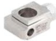
Abrazadera de Conexión Fijador Externo