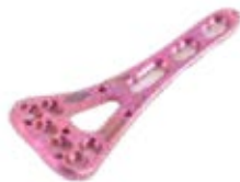
Placa Radio Distal A/V 925T 3 a 7 Orificios