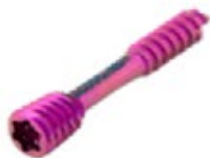
Tornillo Canulado Herbert 2.0mm Titanium