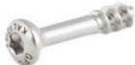
Tornillo Esponjoso 3.5mm Rosca Parcial