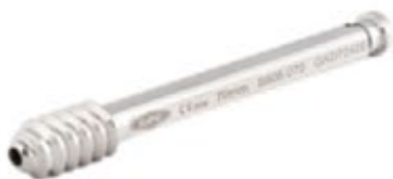
Tornillo Deslizante Pediátrico