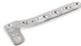
Placa "L" c/Soporte Bloqueada