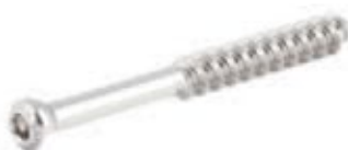
Tornillo Esponjoso 6.5mm Rosca 32