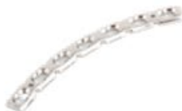
Placa Reconstrucción Bloqueada Curva 920C 4 a 10 Orificios