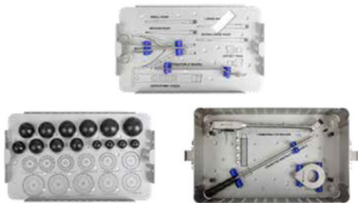
INSTRUMENTAL NO CEMENTADA (BIPOLAR)