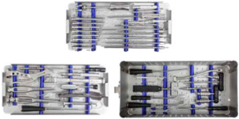
INSTRUMENTAL NO CEMENTADA (STEM)