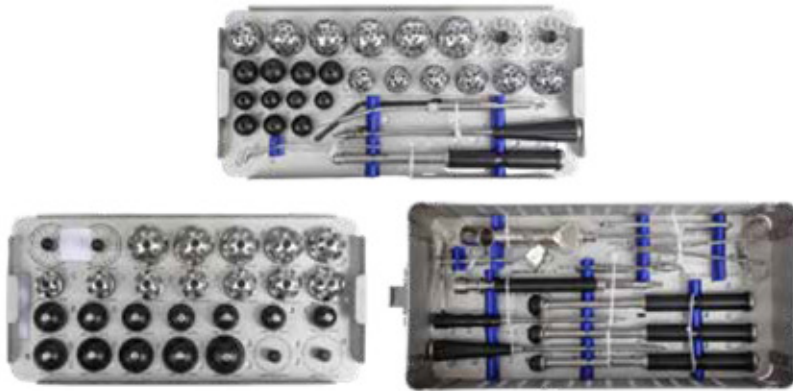
INSTRUMENTAL NO CEMENTADA (CUP)